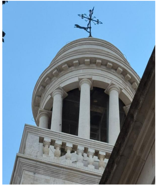
Torre dell'orologio – Piazza Plebiscito

Ci troviamo davanti al degrado estetico del centro storico del paese: le grandi colonie di piccioni e i loro escrementi contribuiscono al degrado estetico delle città. È molto facile trovare le pareti degli antichi palazzi imbrattate dal guano, accumuli di guano sui cornicioni o escrementi presenti su piazze e vie pubbliche. Questa presenza massiccia di piccioni provoca danni alle strutture architettoniche presenti: gli escrementi dei piccioni sono altamente corrosivi e possono causare danni significativi agli edifici, monumenti e infrastrutture. Questo porta a costi elevati di manutenzione e restauro.