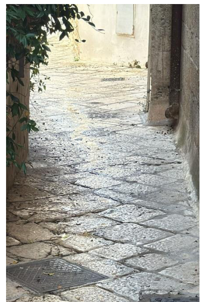
Foto 1,2,3 - Via Campanile