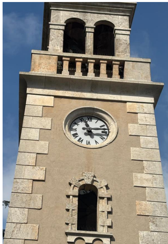
Torre dell'Orologio Chiesa di San Domenico